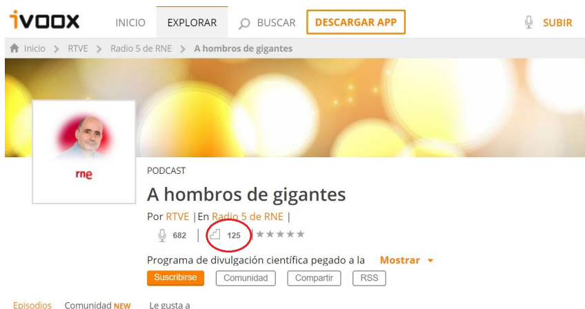
Imagen 7. Puesto 125 en la clasificación de Ivoox

La red ha supuesto el fin de la tiranía de los horarios y la fugacidad de la palabra, puesto que desde cualquier dispositivo conectado a Internet se pueden recuperar nuestros programas bien en nuestro sitio web ( www.rtve.es/alacarta/audios/a-hombros-de-gigantes/ ), bien a través de plataformas como Ivoox, SounCloud, iTunes y Player FM, entre otras. El programa goza de gran popularidad y está entre los diez más descargados de RNE. 1 En el ranking de Ivoox, A hombros de gigantes es el tercero de RNE (la semana del 31 de agosto de 2020 alcanzamos el puesto 125). 2