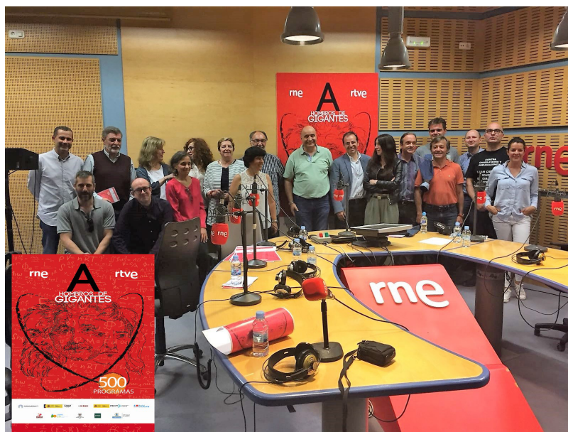
Imagen 2. Grabación del programa nº 500 (13 de junio de 2018)