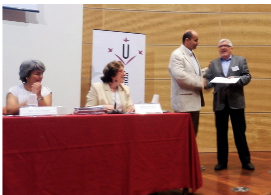
Imagen 4. Entrega del Premio Ciencia en Acción

Durante muchos años, A hombros de gigantes ha sido el único programa de divulgación científica de larga duración (una hora) y alcance nacional de la radiodifusión pública española. Nuestro programa ha sido reconocido con el Premio Especial del Jurado del Concurso Ciencia en Acción 2011 y con el Premio SAC'YR "Hacemos lo imposible" (2011).