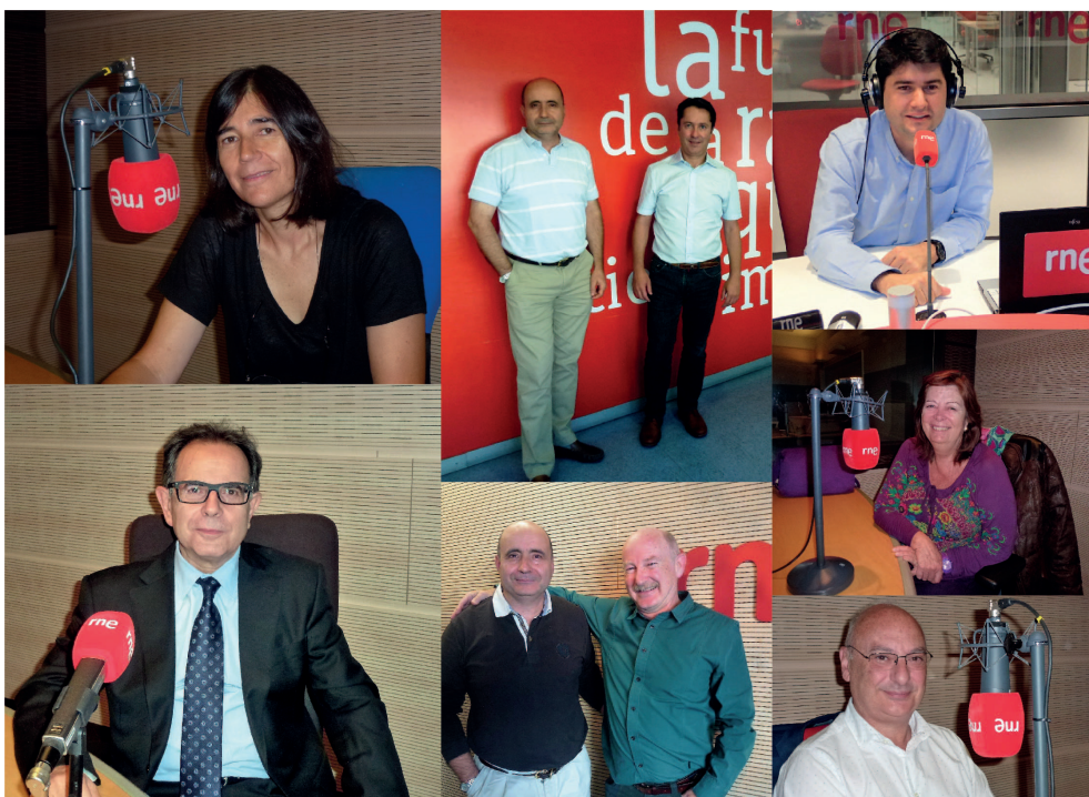
Imagen 3. Investigadores que han pasado por el programa