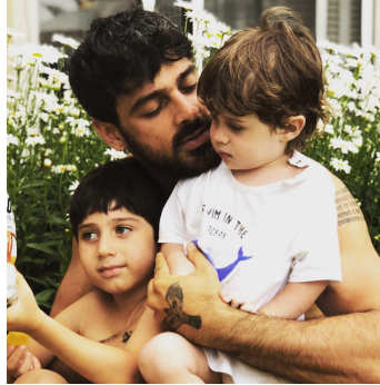
Figura 3. “Hombre de familia a la italiana”

11/08/2020). En este caso, una misma nota incluye denuncia feminista, promoción de celebridades y películas, moral patriarcal y discusión de la cultura de masas.