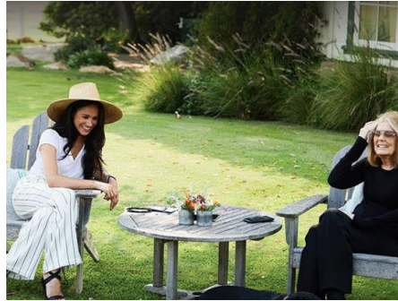
Figura 2. “Quién es Gloria Steinem, la feminista que admira Meghan Markle (y que estrena película con Julianne Moore)”